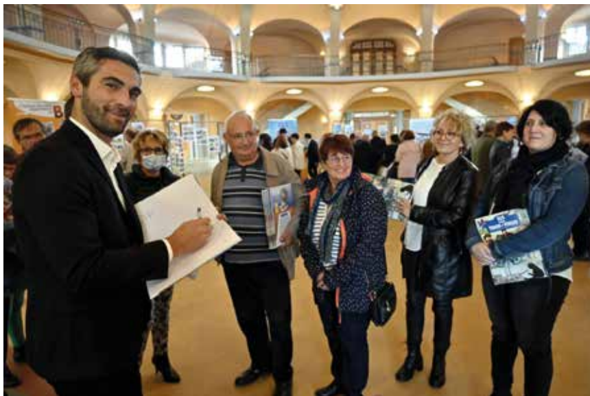
Monsieur le Maire s'est prêté au jeu des dédicaces

Je garde de ce travail d'équipe un souvenir impérissable ! Ici, c'est Thaon les Vosges ! ”