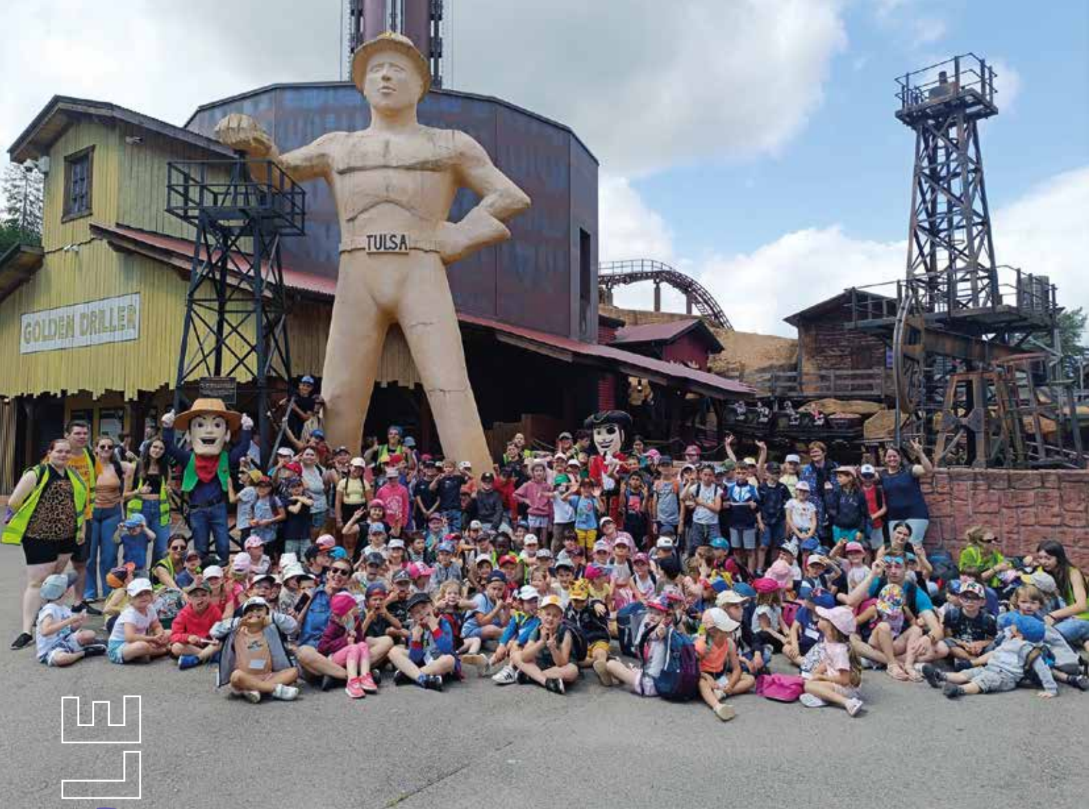
Sortie à Fraispertuis