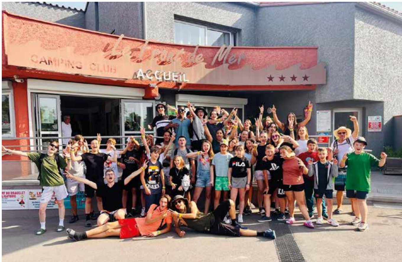
Séjour à Argelès-sur-Mer