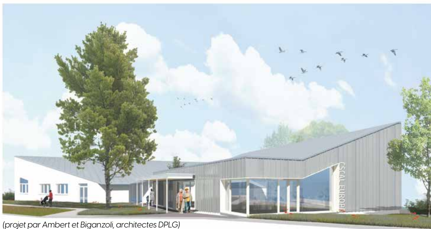
(projet par Ambert et Biganzoli, architectes DPLG)

Un projet de plus d'1,5 Millions d'euros qui a déjà reçu le soutien financier appuyé de la Caisse d'Allocations Familiales et de l'Etat par le biais de la Dotation d'Equipement des Territoires Ruraux.