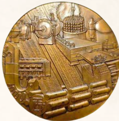
Médaille du centenaire de la BTJ